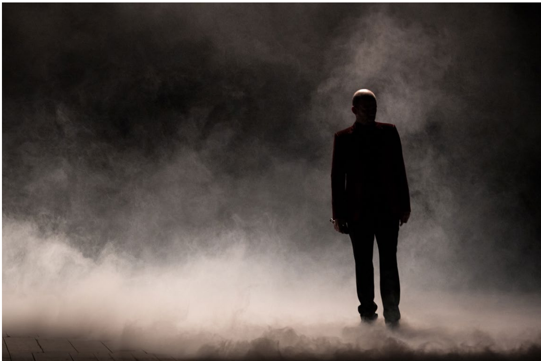
Peut-être pas - Cie Tabula Rasa, décembre 2022.

C'est que j'ignorais encore tout de l'épaisseur de ce mot-là.