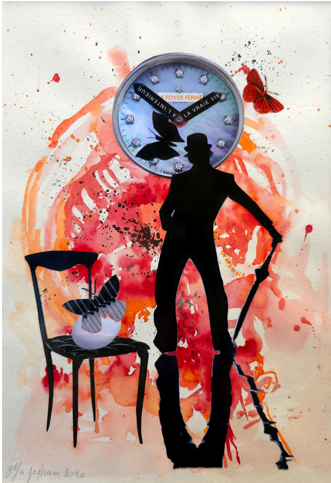
Illustration Alpha Jegham